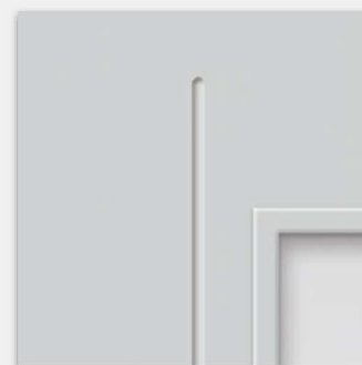
typ frezowania w kolekcji BINITO